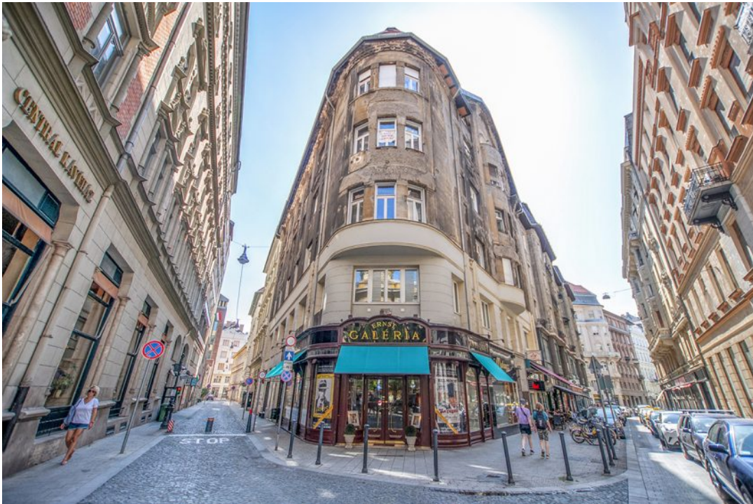
Az Irányi utca és a Cukor utca találkozási pontja / Fotó: Németh Krisztina – Egy jó kép rólád

haladunk a Centrál Kávéház mellett, mielőtt a Cukor utcai elágazásnál találánánk magunkat. A keskeny, belvárosi utcácska találkozásánál a 20 éves múltra visszatekintő Ernst Galéria helyisége visz párizsias hangulatot az V. kerület szívébe. Folytatva utunkat a szűk Cukor utcán, hamarosan újabb kereszteződéshez érünk, itt találjuk ugyanis a méltatlanul eldugott ...nszky János közt, melynek Veres Pálné utca felőli végén térhetünk be a mennyei reggeliket kínáló Portobello Coffee & Wine-ba .