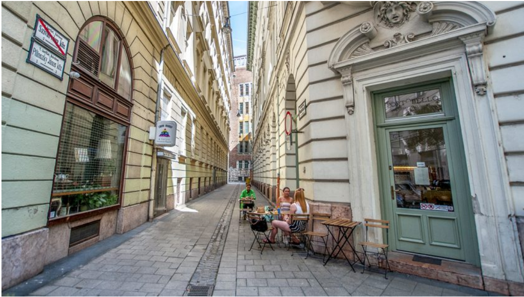
Pilinszky János köz a Portobello asztalaival / Fotó: Németh Krisztina – Egy jó kép rólad