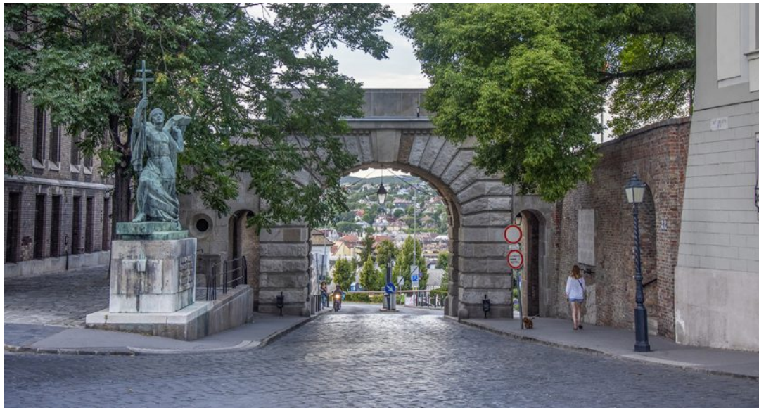
Kilátás a budai dombokra a Bécsi kapu térről