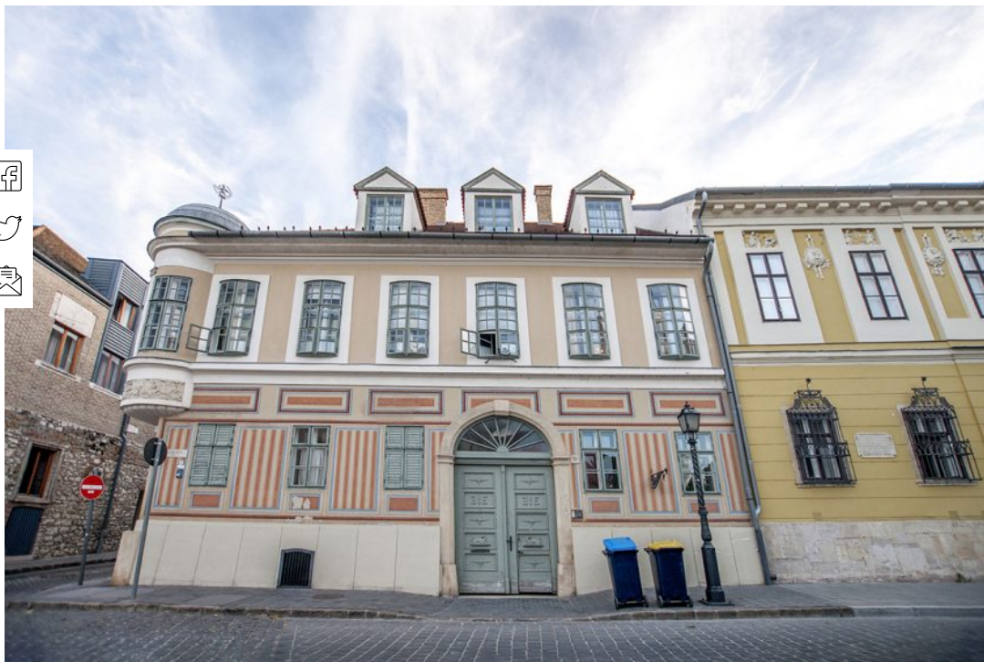
Klasszicista épület a Bécsi kapu tér 8. szám alatt