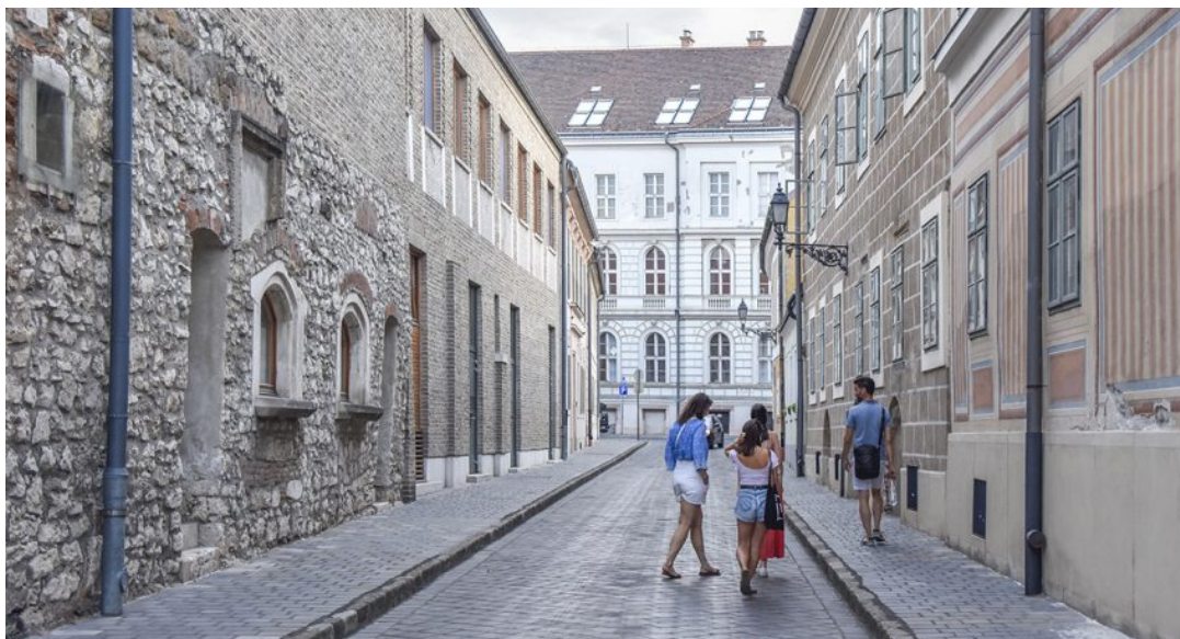
Séta a Kard utcán