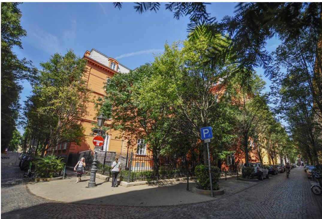
A Reviczky utca és a jelenleg átépítés alatt lévő Ötpacsirta utca találkozása / Fotó: Németh Krisztina – Egy jó kép rólad

☒ Fővárosi Szabó Ervin Könyvtár impozáns palotája mellett elhaladó Reviczky utca beletorkollik mindig nyüzsgő Baross utca elejébe, valamint találkozásuknál indul a hangulatos Ötpacsirta utca a Nemzeti Múzeum kertje felé. Míg az árnyas Reviczky utca a mediterrán hangulatot idéző, a hém Mikszáth térre visz, az Ötpacsirta utcán gyalogolva elhaladunk Budapest talán legszebb fűvel borított udvara, a borostyánokkal befuttatott Almássy-palota mellett, ahol jelenleg az újonnan nyitott Arquitecto Pitpit spanyol tapasbár székel.