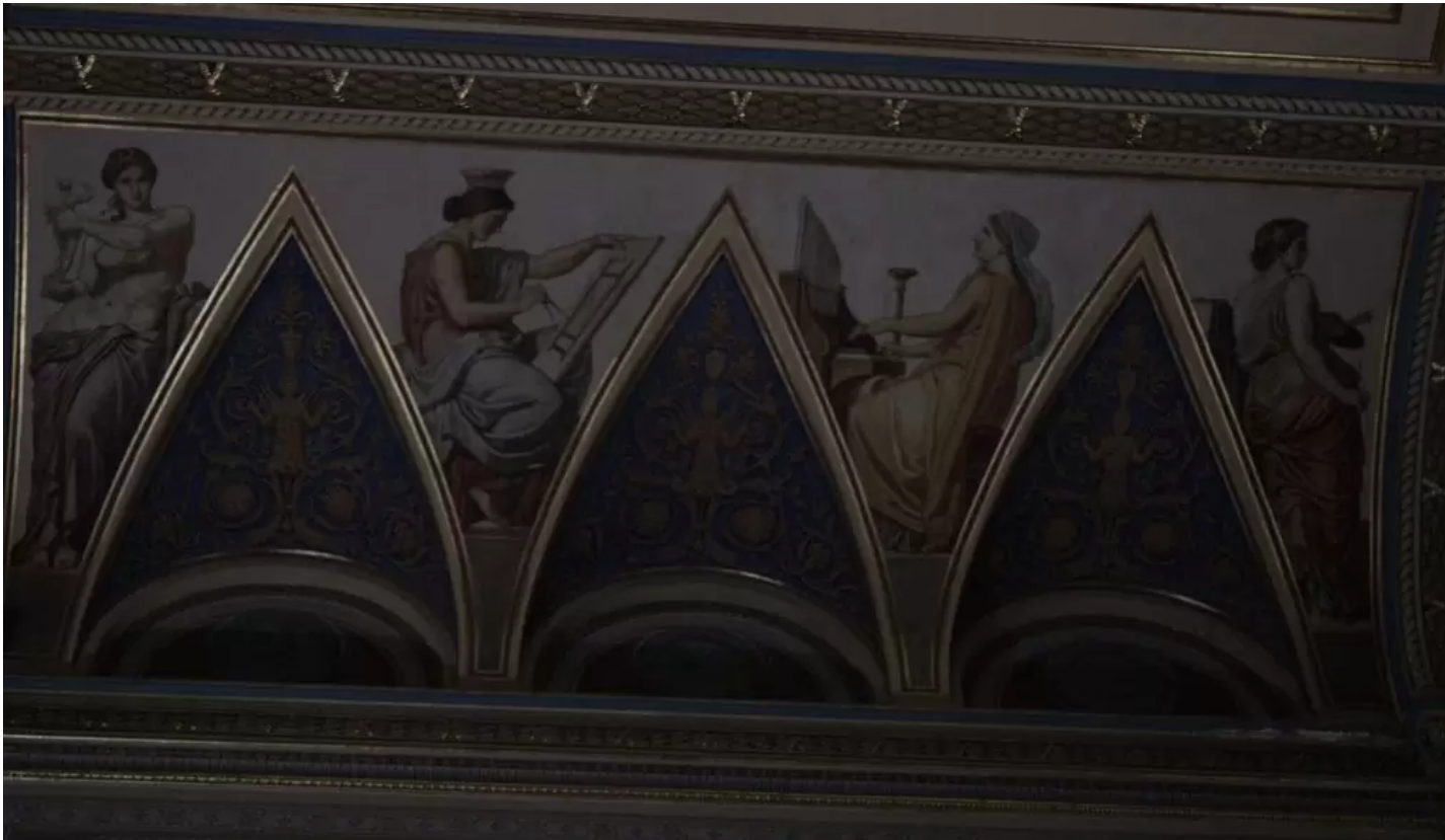
A nagy olvasóterem: Lotz Károly a művészetek allegorikus alakjait ábrázoló mennyezeti freskói

Az emeleti tárgyaló ékessége a díszes cserépkályha – amelyről biztosan tudjuk, hogy a főigazgatói lakás része volt –, valamint az épületről készült korábbi fotók gyűjteménye. A tárgyalóból nyíló tágas teraszcsoportról látszik, hogy milyen sok terem és épületrész áll a tudományok és kutatóik szolgálatában. A gyűjtemény széles választékából kiemelkednek a filozófiai és teológiai szerzemények, és számtalan történelmi jelentőségű kuriózum is gazdagítja a gyűjteményt.