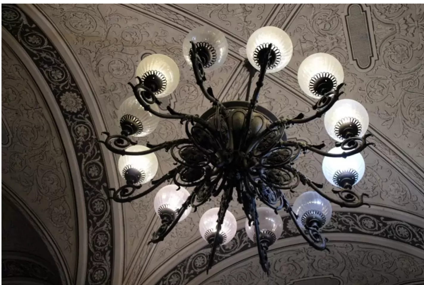
Az előcsarnok mennyezetdíszítése

Az egyetem 1950-ben vette fel a világhírű fizikus, Eötvös Loránd nevét, akiről jelenleg egy izgalmas kiállítással is megemlékeznek a könyvtár.