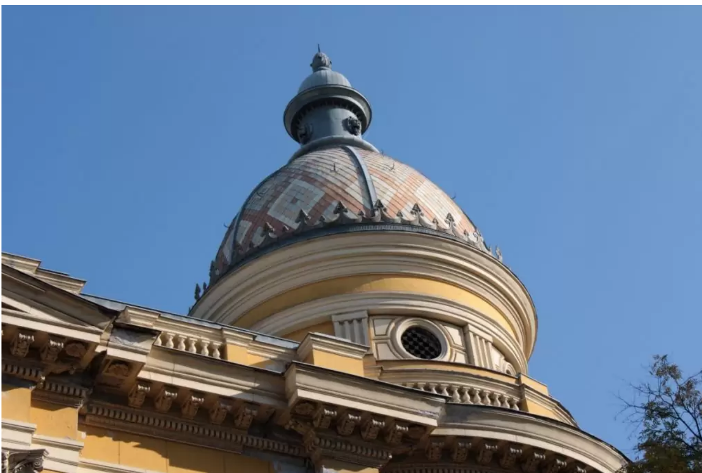
A színes palával borított kupola

1877-ben, az orosz–török háború előestéjén a tudományegyetem diákjai törökbarát tüntetést tartottak. A török szultán hálája jeléül a Budáról, a királyi könyvtárból valószínűleg még II. Szulejmán csapatai által elvitt könyvek közül 35 kódexet – köztük a már említett corvinákat – az egyetem könyvtárának ajándékozta.