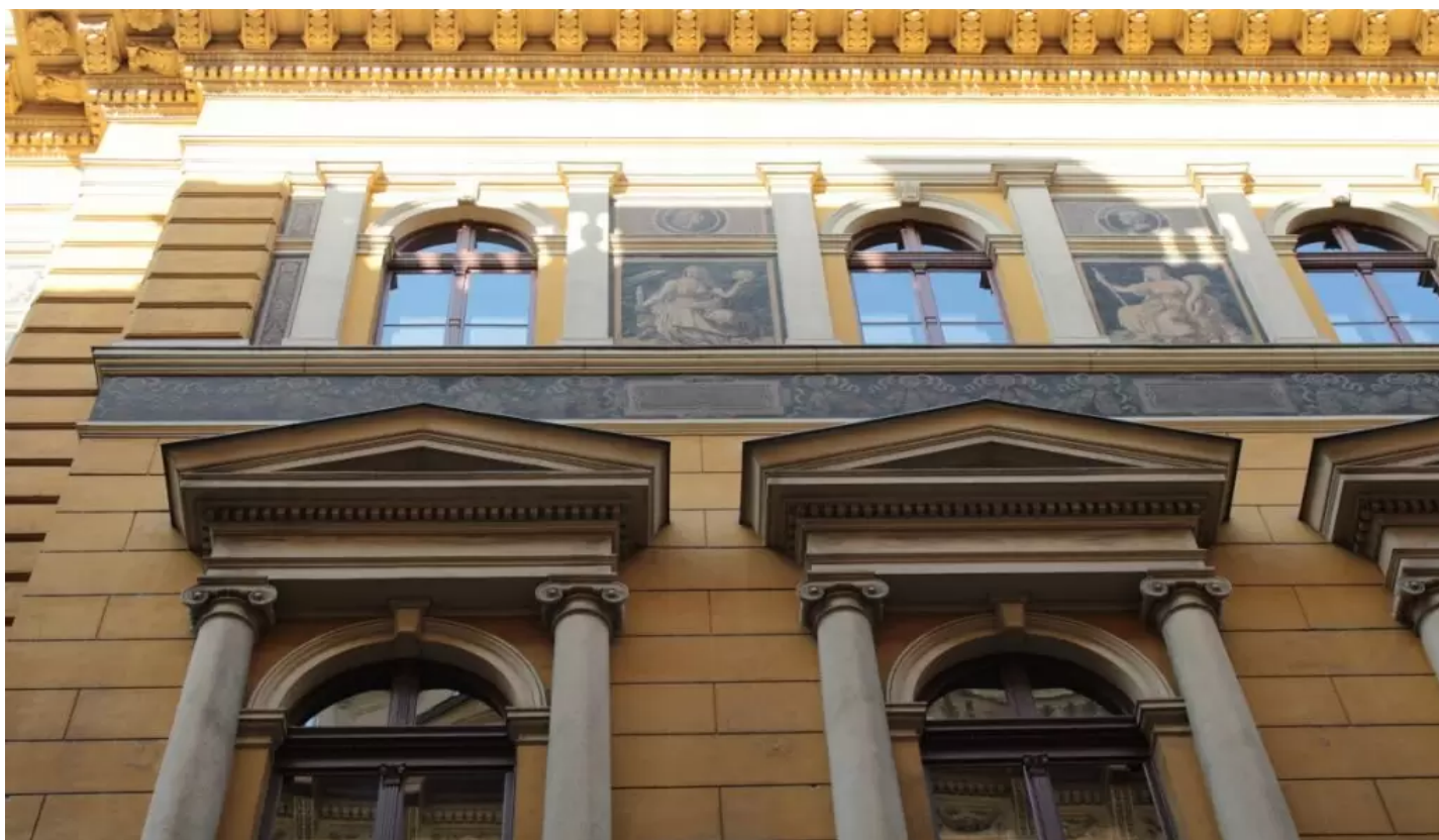
A Reáltanoda utcai homlokzat

A jezsuita rend révén távoli vidékek szakirodalmi is gazdagította a gyűjteményt. A rend 1773-as feloszlása után az egyetem és vele együtt a könyvtár is állami tulajdonba került: a Magyar Királyi Tudományegyetem 1777-ben Budára, 1784-ben Pestre, az egyetem könyvtára pedig jelenlegi helyére, az akkori ferences kolostor épületébe költözött.