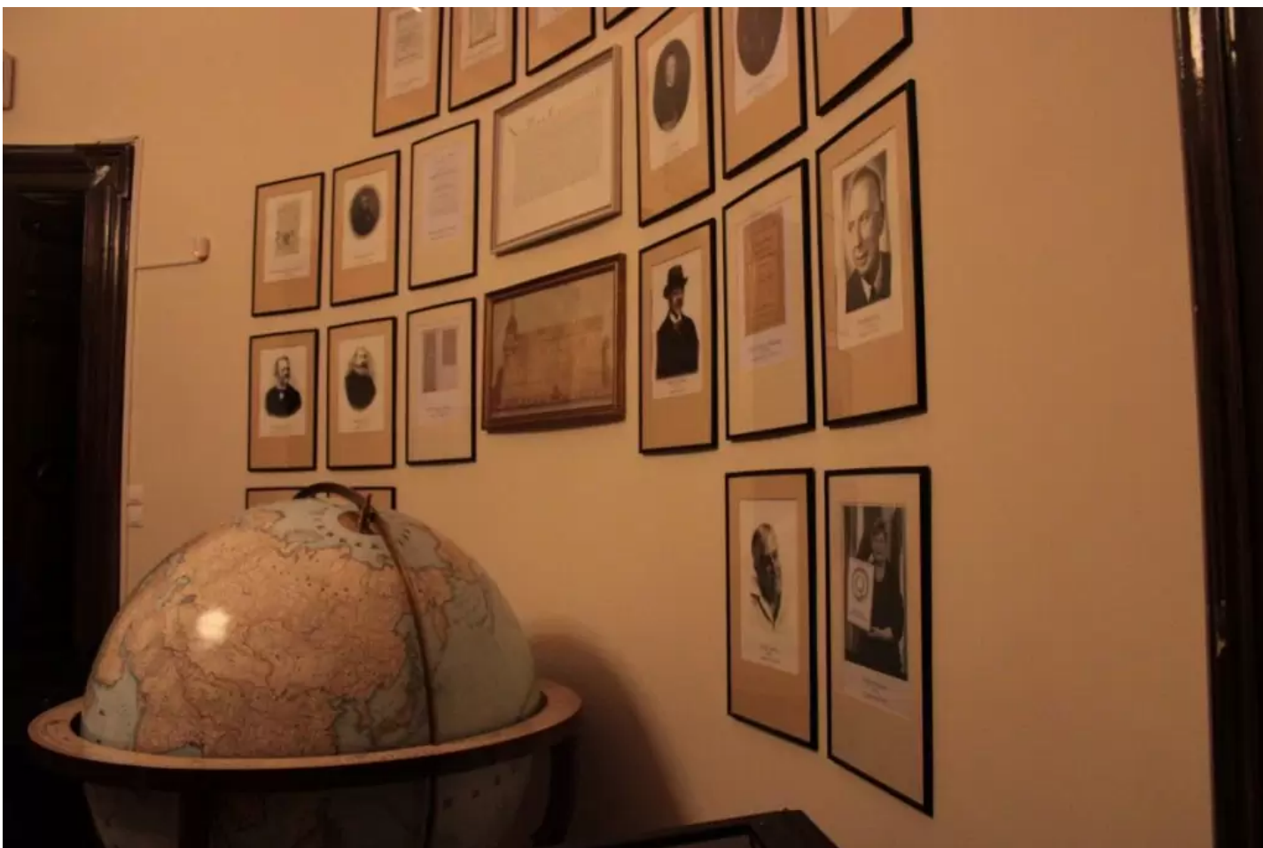
A főigazgatói iroda

A szoba díszje még a nevezetes Perczel-féle földgömb másolata, az egyetem eredeti alapítólevelének – szintén az intézmény által birtokolt – másolata, a 2018-ban elnyert Magyar Örökség Díj és Minősített Könyvtár cím, valamint a 2020-ban elnyert EFQM „Elkötelezettség a Kiválóságért” tanúsítvány oklevele és a könyvtáráépület Reáltanoda utca felőli homlokzatáról készült akvarell. A teremben valamennyi egykori főigazgatóról is megemlékeznek egy-egy fotó vagy legjelentősebb műveik címlapja másolatának erejéig.