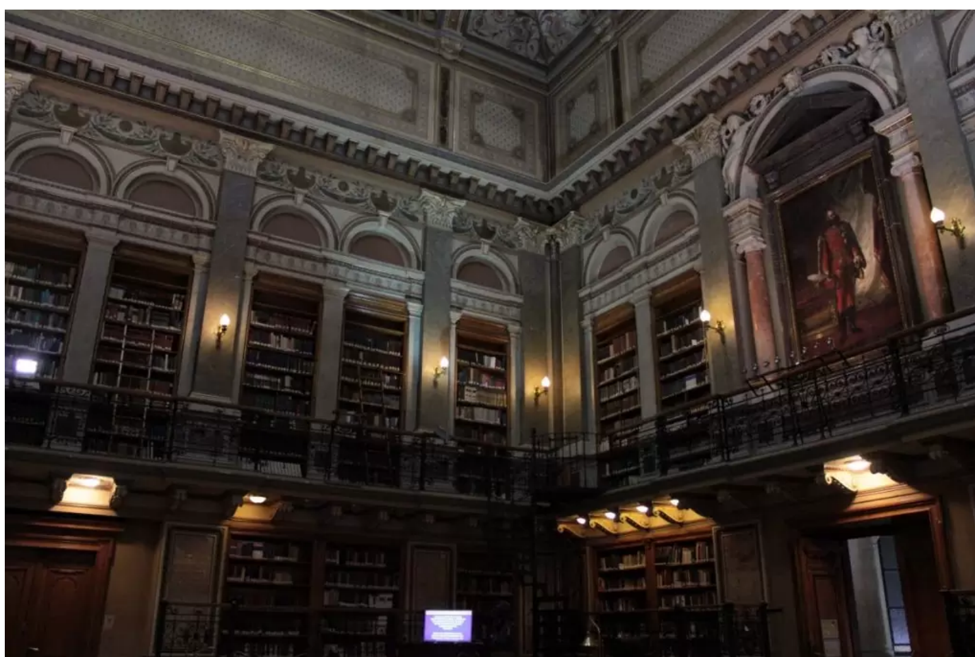
A nagy olvasóterem

Pray György a Budára költöztetett könyvtár első igazgatója volt, de nevét elsősorban nem igazgatói tevékenysége révén ismerheti az utókor, hanem a róla elnevezett kódexről, amely első magyar összefüggő nyelvemlékünk, a Halotti beszédet tartalmazza. Az egykori sacramentarium, azaz könyörgésgyűjtemény első tudományos leírása fűződik nevéhez.