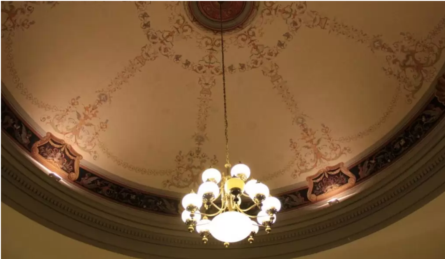
A főigazgatói iroda mennyezete